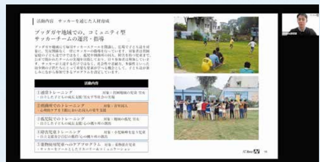
「第4回 One Step Forward」の開催の様子

これらの話を聞いた参加者たちは感想を互いに伝え合い、SDGsのゴールの1つである「ジェンダー平等を実現しよう」に関して、最近気になっていることや、実際に取り組んでいることなどを共有しました。最後に参加者たちが「大学でSDGsについて学ぶ授業があるので、そこで多様な人の意見を聞き、考えや意見を深めていきます」「情報収集を一生懸命やります」など、これから挑戦していくことを宣言し、「第4回 One Step Forward」が終了しました。