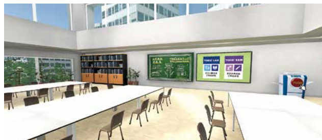
2階の自習スペース

※テスト前のモチベーションアップなどに効果的（効果は気持ちの問題で個人差がある）