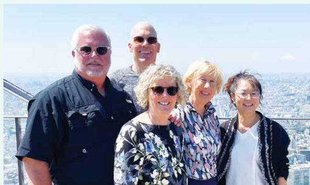
口コミで依頼があった初来日のアメリカ人観光客をご案内している様子

訪日外国人観光客だけでなく、観光ボランティアガイドにとっても有意義な取り組みが、さらなる広がりを見せようとしています。