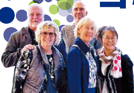
TOKYO FREE GUIDE