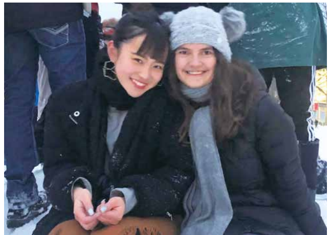
大学生のとき1年間留学したアメリカの大学にて

学校や塾以外に毎日8時間以上学習して、高校の2年間はまさに英語漬けの日々でした。でも、やればやった分だけ実力になって自分に返ってくるのが分かるので、とにかく楽し