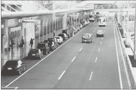
airport terminal / so